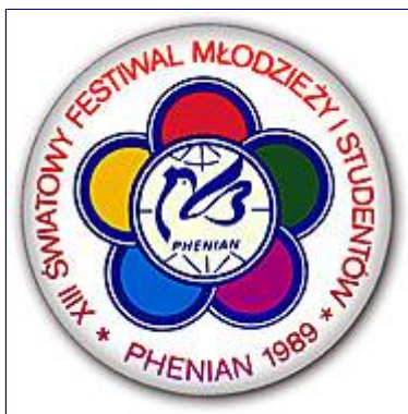
XIII Festiwal Młodzieży w KRL-D, rok 1989

Zrozumiałe jest zadowolenie Twórcy Taekwon-do, kiedy w lipcu, Taekwon-do zostało oficjalnie włączone do programu XIII Światowego Festiwalu Młodzieży i Studentów w Pyongyang w KRL-D.