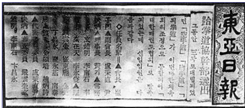
Pierwsze wybory władz Koreańskiego Związku Taekwon-do

W tym samym roku, Choi otrzymał dwa zaszczytne stanowiska: Prezydenta nowo utworzonego Koreańskiego Związku Taekwon-do oraz zastępcy dowódcy II Armii stacjonującej w Tae Gu.