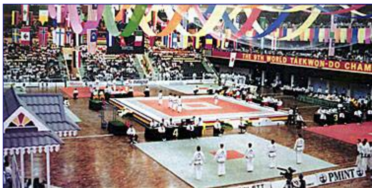
IX Mistrzostwa Świata w Kuala Terengganu, Malzja, rok 1994

Mamy nadzieję, że wszyscy instruktorzy pójną w ślady generała, poświęcając część swojego czasu dla promocji Taekwon-do w swoim kraju. Zakładanie szkół Taekwon-do to nie wszystko. Instruktor musi pamiętać o właściwej postawie, dzięki której będzie świecił przykładem dla wszystkich studentów. Wtedy, i tylko wtedy, instruktor może uważać się za głosiciela Taekwon-do.