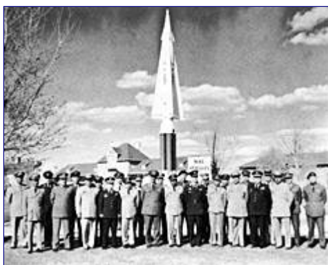
Gen. Choi w Teksasie, USA

W tym samym roku generał Choi Hong Hi wydał swoją pierwszą publikację dotyczącą Taekwon-do, która stała się wzorem dla wydania z roku 1965.