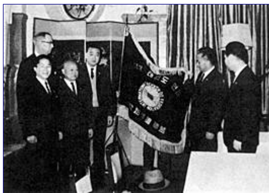
22 marca 1966: powstanie International Taekwon-do Federation.

22 marca powstała Międzynarodowa Federacja Taekwon-do, obejmująca związki narodowe Wietnamu, Malesji, Singapur, NRF, Stanów Zjednoczonych, Turcji, Włoch, Egiptu i Korei.