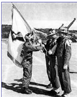
Flaga 29 Dywizji projektu gen. Choi Hong Hi