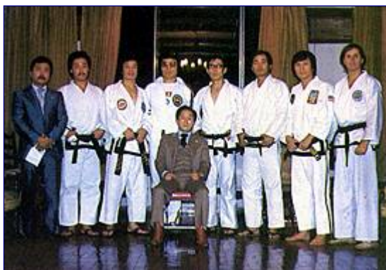
VI Międzynarodowa Drużyna Pokazowa