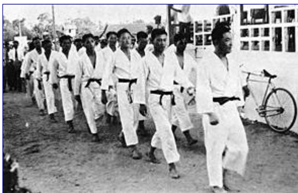
Grupa pokazowa w Wietnamie