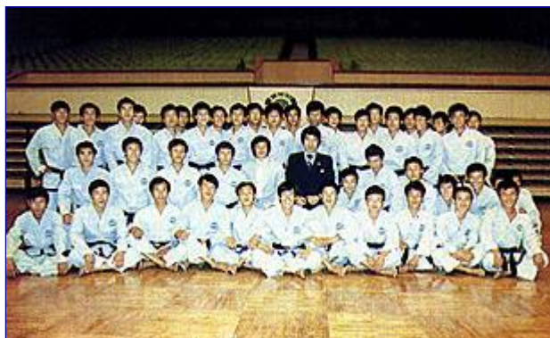
Członkowie założyciele Taekwon-do ITF w KRL-D, 1981 r.

W październiku prowadził seminarium dla grupy założycielskiej Taekwon-do w Koreańskiej Republice Ludowo-Demokratycznej, a w listopadzie, z dumą zaprezentował na historycznym spotkaniu w Wiedniu połączoną drużynę pokazową, składającą się z instruktorów północno i południowokoreańskich, zwaną North and Overseas Christian Leaders.