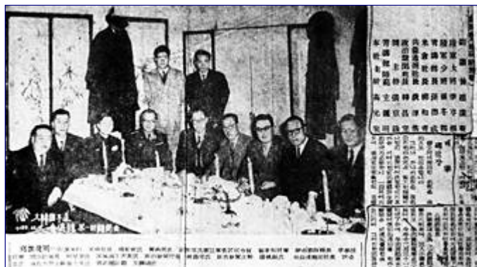
Posiedzenie Komisji 11 kwietnia 1955 r.

11 kwietnia komisja zwołana przez generała Choi, zdecydowała o przyjęciu przedstawionej przez niego nazwy „Taekwon-do”. Ta jedna nazwa, Taekwon-do, zastąpiła dotąd stosowane, różne mylące terminy: Dang Soo, Gong Soo, Taek Kyon, Kwon Bup, itp.