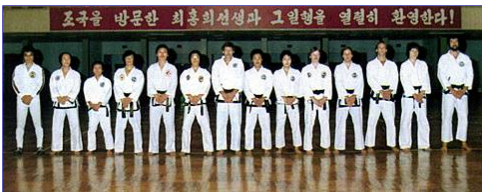
Grupa pokazowa Taekwon-do ITF w KRL-D, 1980 r.