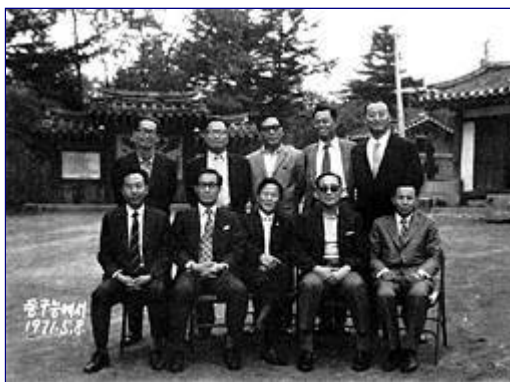
Przewódcy Żołnierskiego Ruchu Studentów Pyongyang