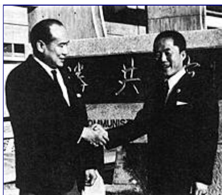
Masutatsu Oyama odwiedza gen. Choi.

Pod koniec 1967 roku, gen. Choi zaprosił do siedziby ITF w Seulu mistrza Masutatsu Oyamę w celu kontynuacji dyskusji rozpoczętej w Hakone, w Japonii, nad ewentualnym porzuceniem przez mistrza Oyamę technik Karate na rzecz technik Taekwon-do.