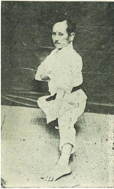
Zdj. 1 86