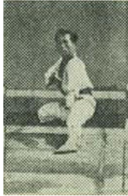
Zdj. 2 87